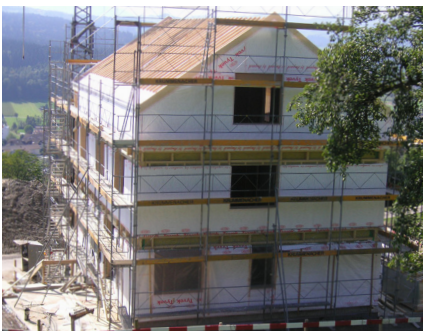
Ansicht von Norden, im Hintergrund Ruswil