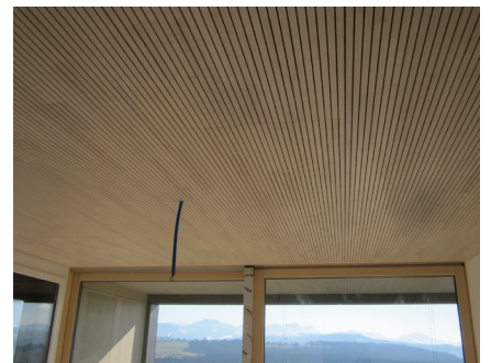
Deckenverkleidung im Wohnraum